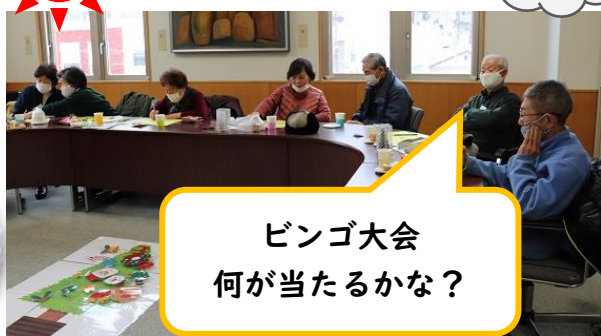
ビンゴ大会 何が当たるかな？