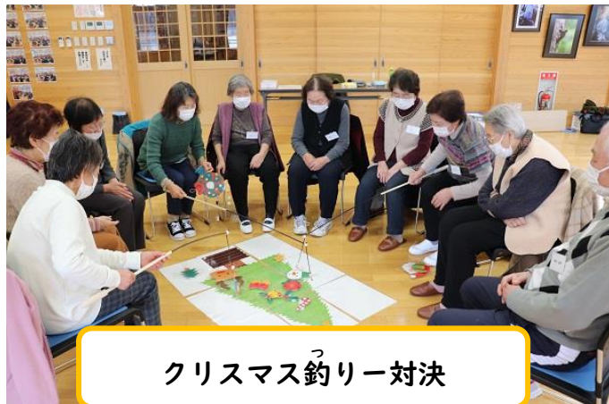
クリスマス釣り対決