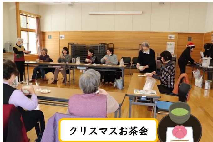
クリスマスお茶会