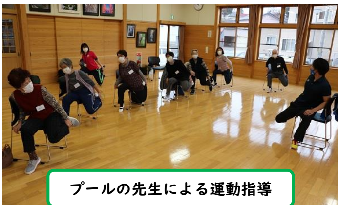
プールの先生による運動指導